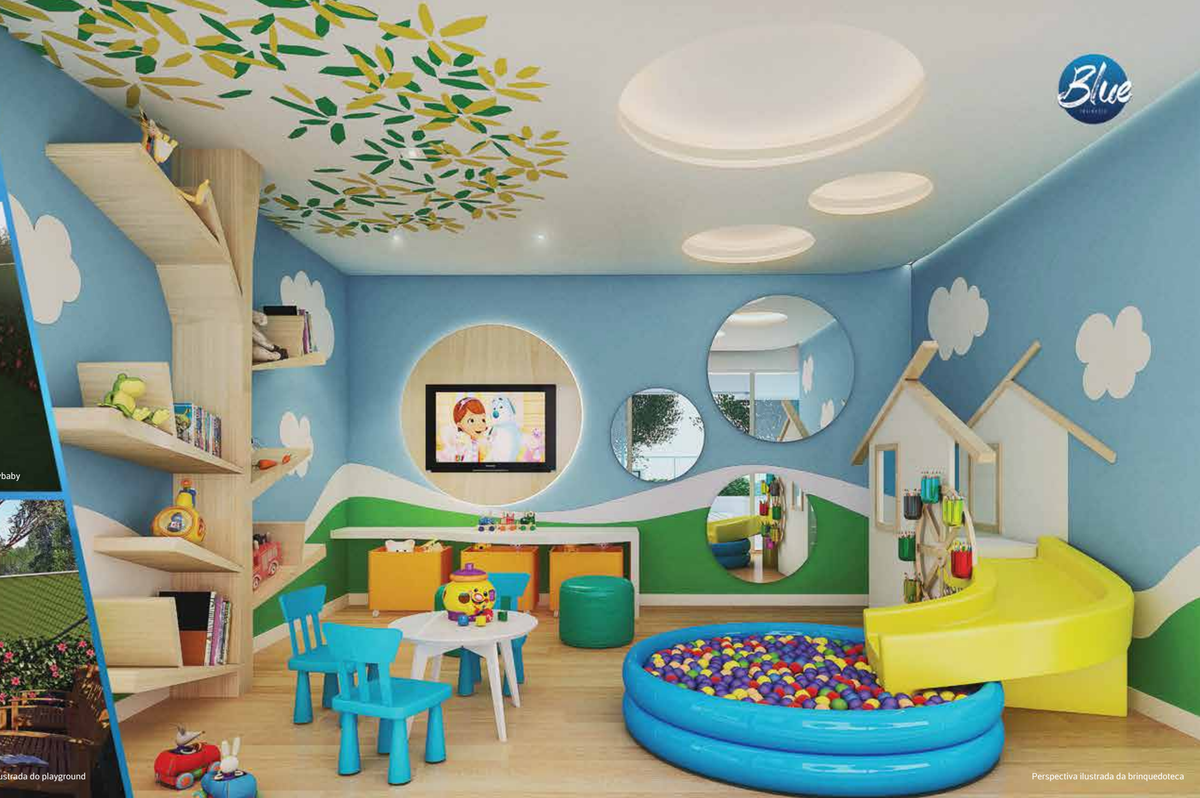
Perspectiva ilustrada da brinquedoteca