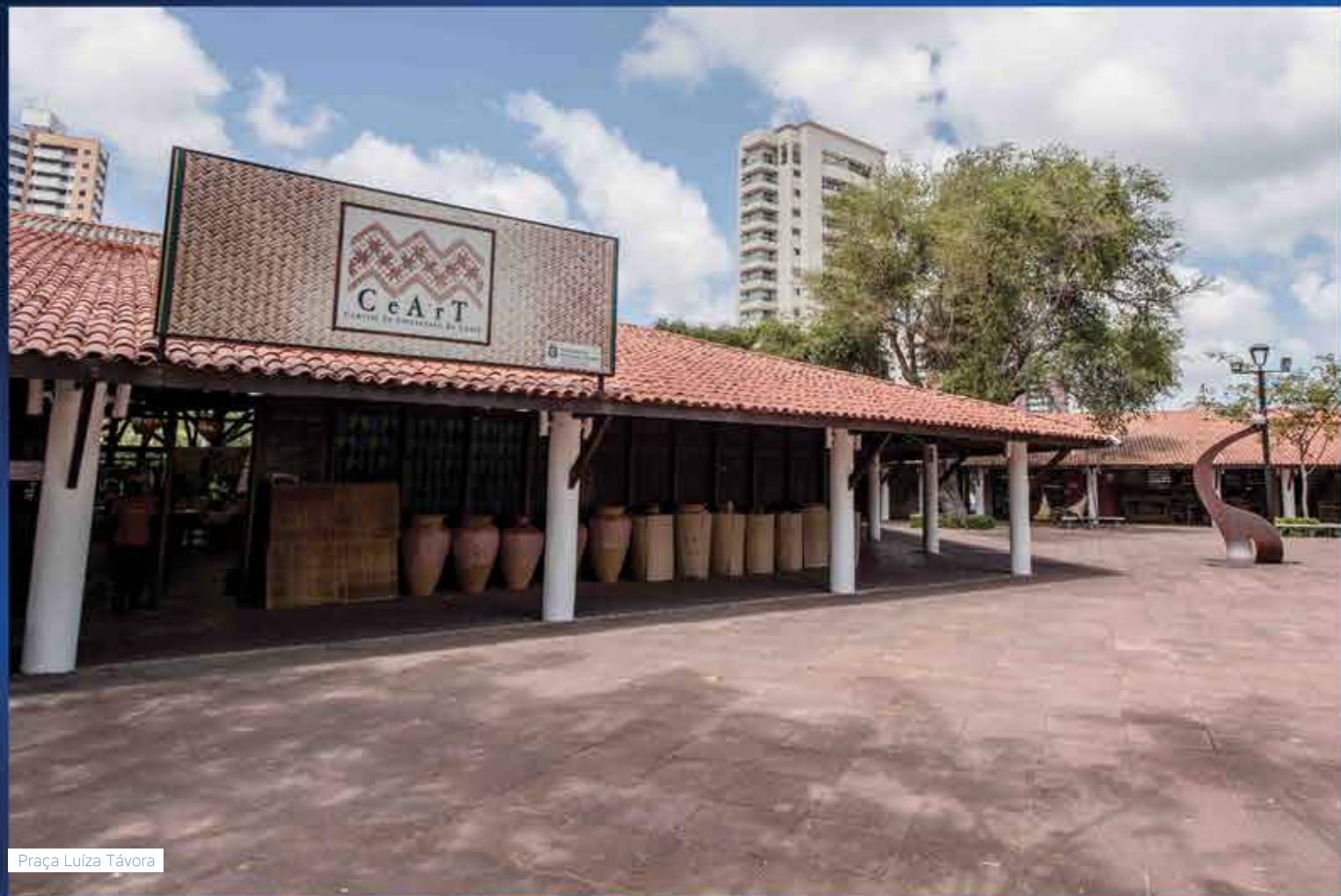
Praça Luíza Távora