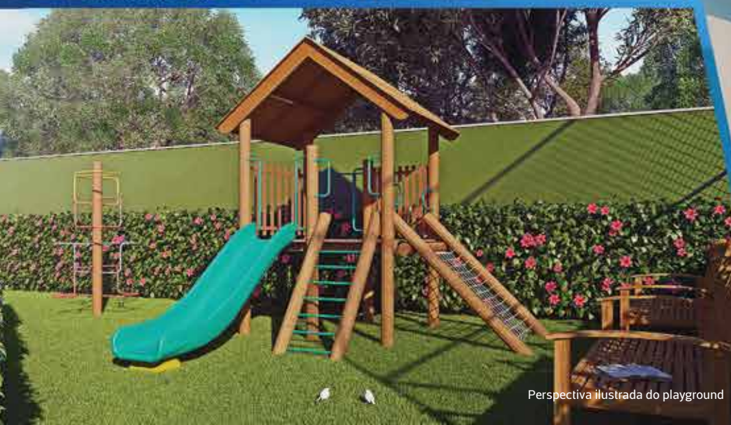
Perspectiva ilustrada do playground