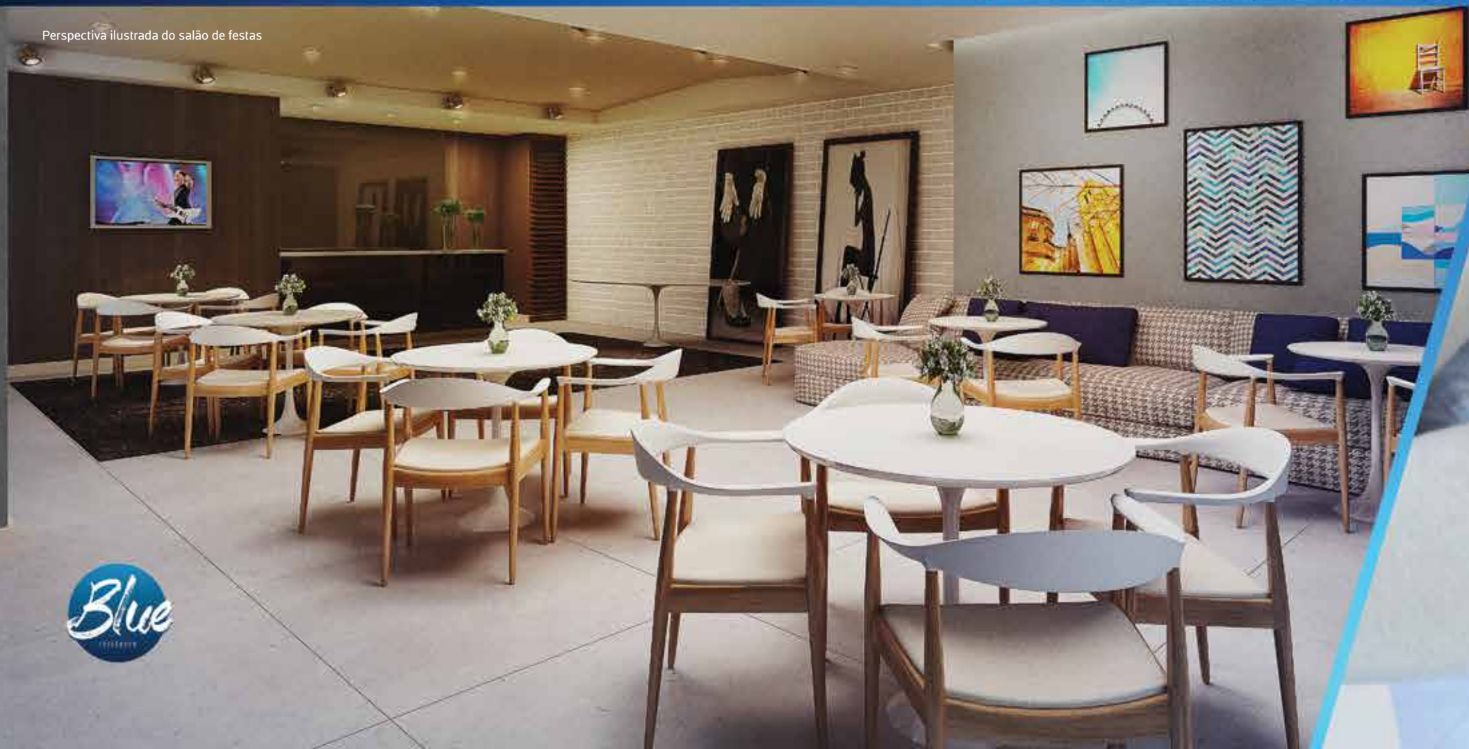
Perspectiva ilustrada do salão de festas