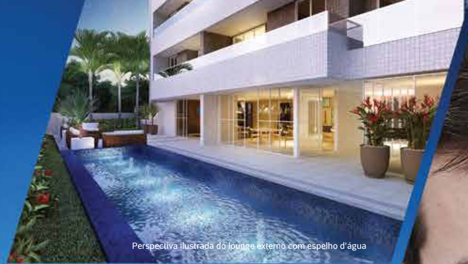
Perspectiva ilustrada do lounge externo com espelho d'água

UM ESPAÇO PARA VOCÊ E SUA FAMÍLIA CELEBRAREM. ALÉM DO SEU APARTAMENTO, CLARO.