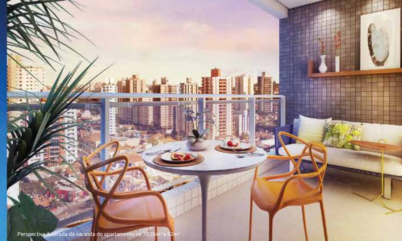
Perspectiva ilustrada da varanda do apartamento de 79,26m 2 a 82m 2