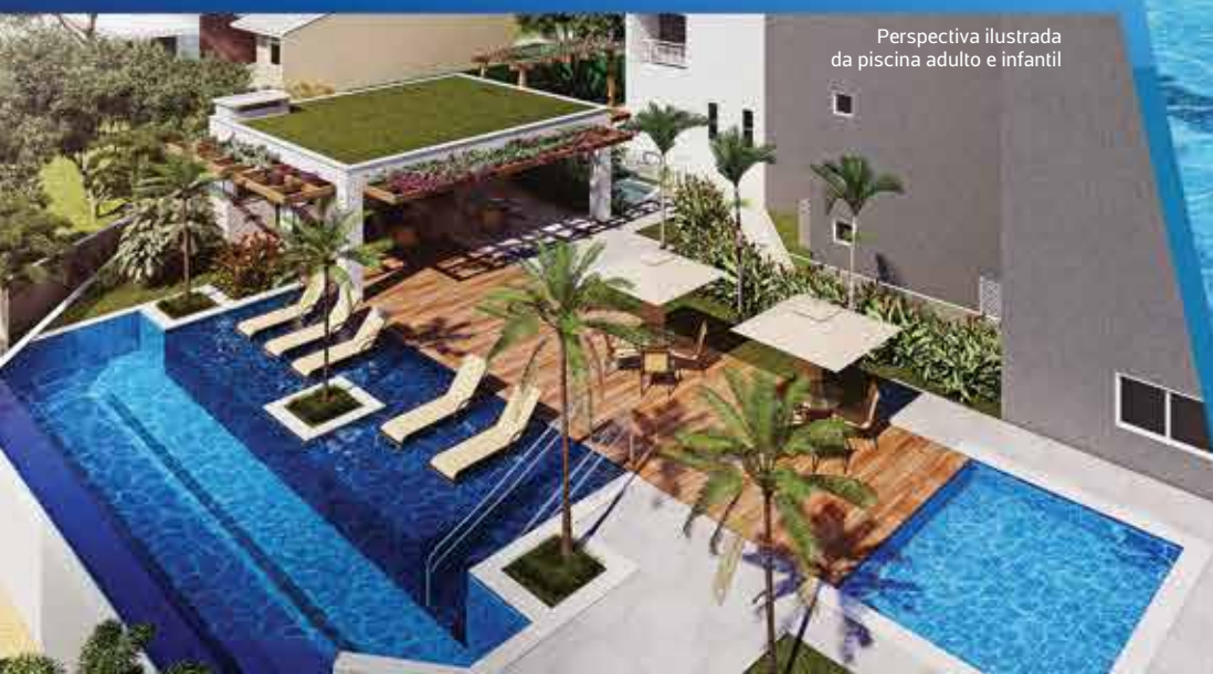
Perspectiva ilustrada da piscina adulto e infantil