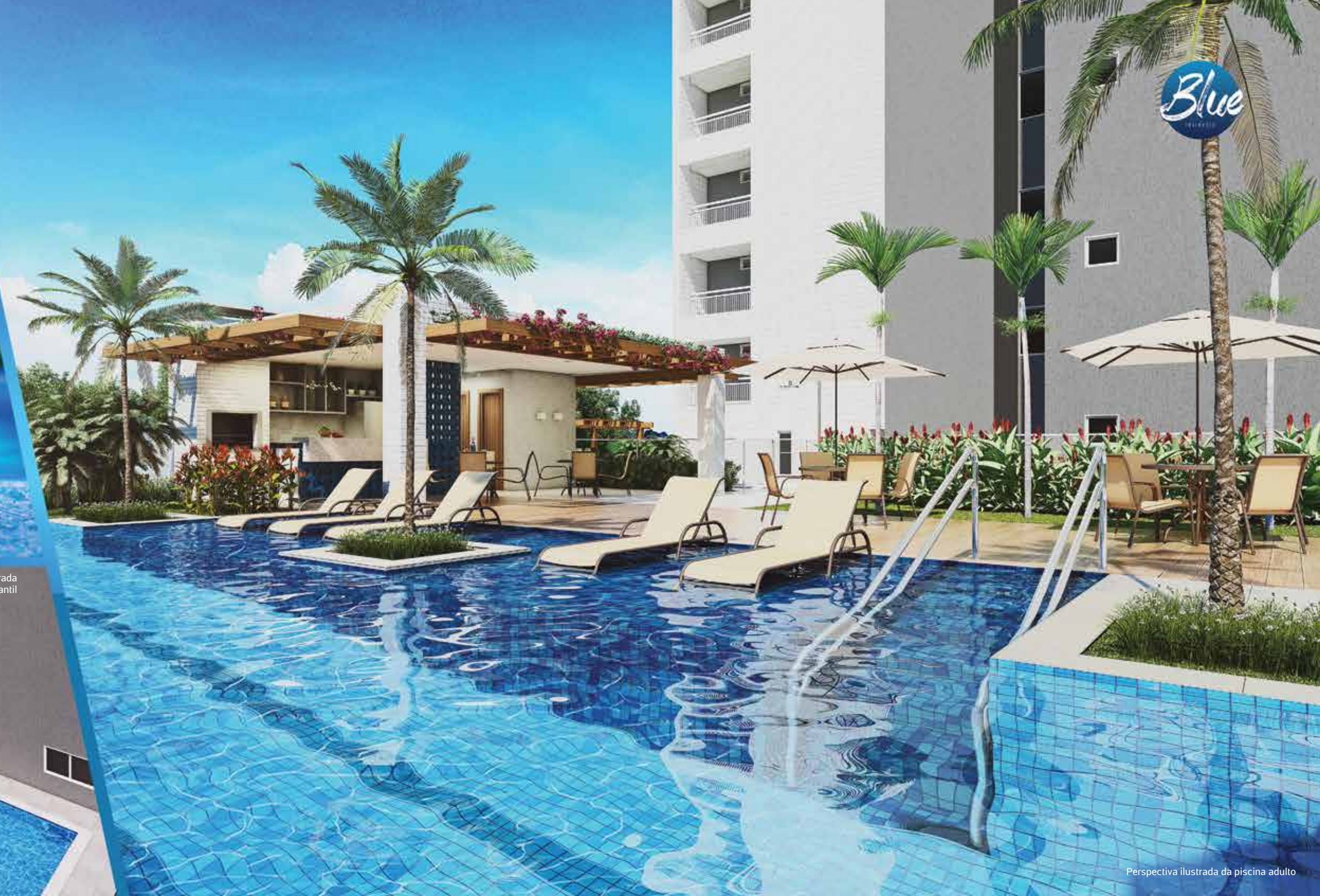
Perspectiva ilustrada da piscina adulto