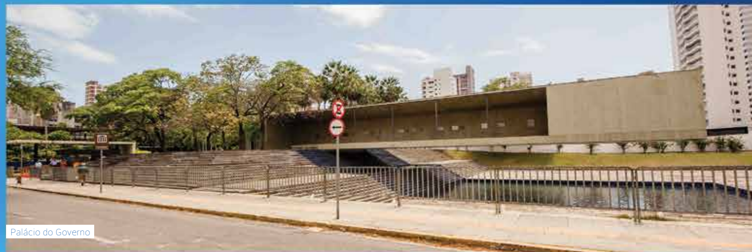
Palácio do Governo

O Blue Residence mistura lazer, conforto, segurança e toda a conveniência de ter comércio e serviços próximo a você. Tudo isso no tradicional bairro Aldeota.