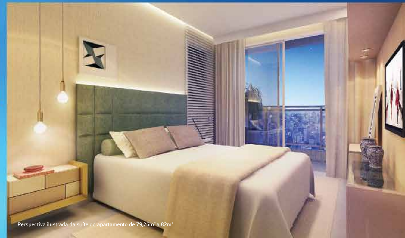
Perspectiva ilustrada da suíte do apartamento de 79,26m 2 a 82m 2

PARA VER COMO SUA VIDA VAI FICAR MAIS BLUE, BASTA OLHAR PELA JANELA. OU PELA VARANDA, VOCÊ ESCOLHE.