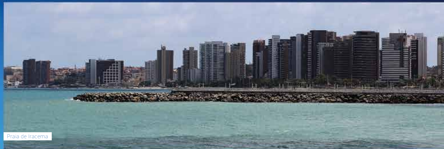
Praia de Iracema