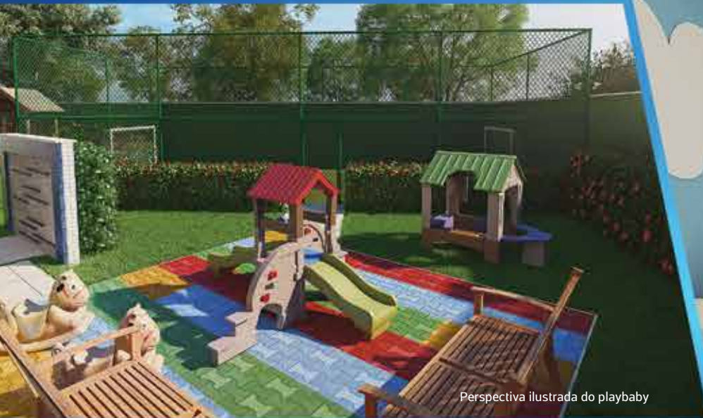
Perspectiva ilustrada do playbaby